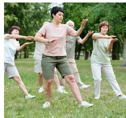
remise en forme