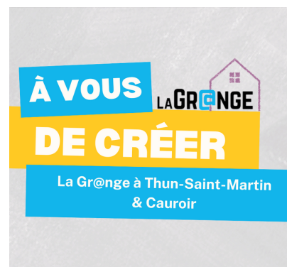
La Gr@nge en libre accès