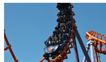
parc d'attraction Walibi