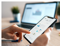
Applications sur mobile et tablette

IDÉES CRÉATIONS À LA GR@NGE EN ENTRÉE LIBRE :